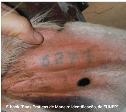
Identificação por tatuagem é de difícil visualização.

Existem outros métodos de identificação animal, como a tatuagem e a marcação à ferro . Mas essas marcações são de difícil visualização , o que faz com que sejam muito maiores as chances de erros durante o manejo, como por exemplo, “cantar” o número errado para quem está fazendo as anotações do manejo.